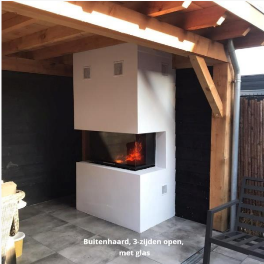
Buitenhaard, 3-zijden open, met glas