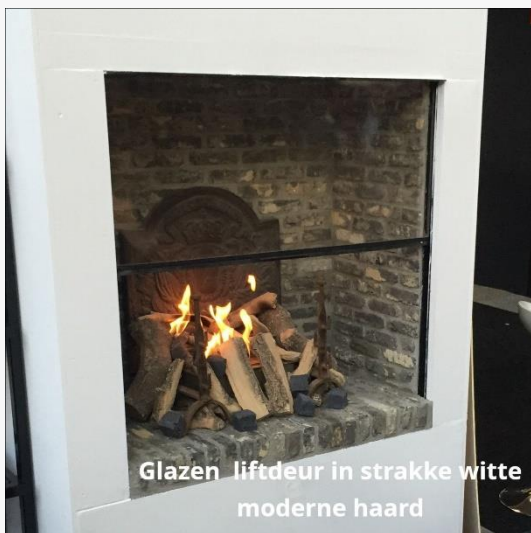
Glazen liftdeur in strakke witte moderne haard